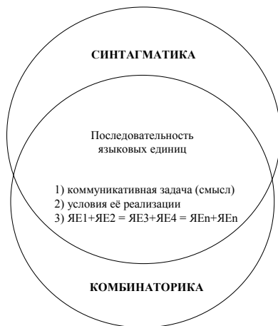
Рис. 2. Соотношение понятий «синтагматика vs. комбинаторика»

делённые ограничения: (1) в решении коммуникативной задачи, (2) в условиях реализации этой задачи, (3) в выборе конкретного набора языковых единиц (ЯЕ), отражающих данный смысл (рис. 2).