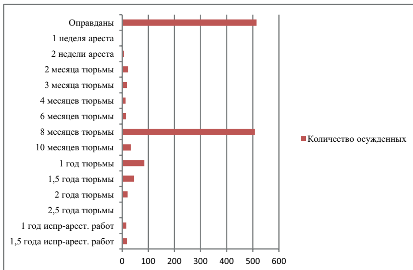
Рис. 2. Приговоры суда по делам об «аграрных беспорядках» осенью 1905 года*

По данным второй диаграммы (рис. 2), наибольшее количество осужденных получили 8 месяцев тюремного заключения. Общее число людей, получивших большие сроки заключения, было относительно невелико. В силу недостатков ведения следствия значительным был процент оправданий.